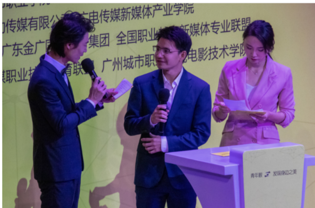
第33届金鸡奖最佳儿童电影导演谢德炬颁发最佳导演奖