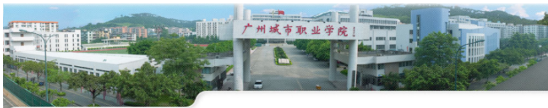
第三届广州（国际）城市影像大赛正式启动（图文）